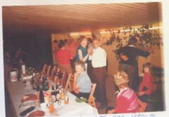
Nyhedsafsnen 1985 Has utro og Eske i vandskabet på Gammelby juni 7

Har du/I en god historie eller lign. I kunne tænke at dele med andre Gammelby borgere, er der altid plads her i nyhedsbrevet. ☺