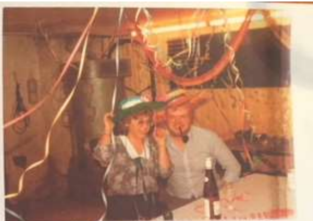
Grate og ved nyhedsafsnen 1985