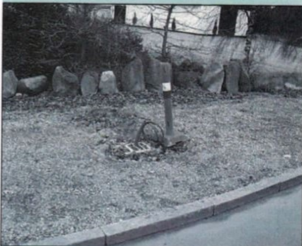
Her skal den nye lysmast stå

Som nævnt i sidste nummer af Nyhedbrevet, så er det lykkedes os at få kommunen til at opstille en ekstra lysmast ved den østlige indkørsel til byen. Det er jo sådan at "krydset" hvor Gammelbyvej går op mod Læborg, ikke er belyst af den eksisterende gadebelysning. Derfor vil de bløde trafikanter være meget udsat for farlige situationer i vinterhalvåret, specielt fra den trafik der kommer øst-fra ind i byen. De kan nemlig ikke se krydset før deres lyskegle rammer det. – Og kører man lidt for stærkt, så er det måske for sent.